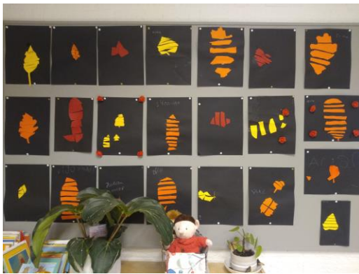
Herfstbladeren in groep 3/4.

Aangezien er in september al gesprekken hebben plaatsgevonden met de ouders en de kinderen van groep 8 n.a.v. het leerlingvolgsysteem voor het voorlopig advies, zullen er nu geen rapportgesprekken met groep 8 plaatsvinden.