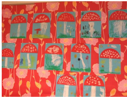
Paddenstoelen in groep 1/2