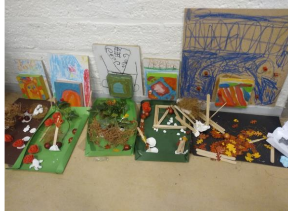
Huisjes met tuintjes gemaakt in groep 3/4.