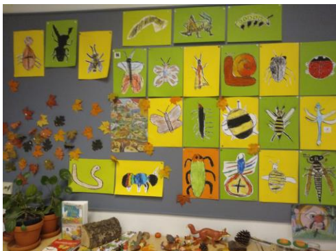
Kriebelbeestjes in groep 5/6

Groep 7/8 gaat zich verdiepen in het werelddeel 'Azië'! De kinderen zullen veel leren over de verschillende landen en zich ook verdiepen in de wereldgodsdiensten