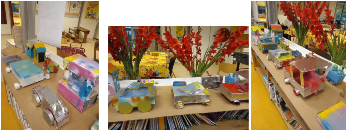
Autootjes gemaakt bij juf Sylvia.

De kinderen hebben daaraan afwisselend individueel en/ of in groepjes samengewerkt en zijn zo spelenderwijs veel sociale, technische en beeldende onderwijskerndoelen tegengekomen ! Er staan enorme, wonderlijke creaties in de hal.