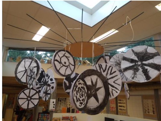
Wielen gemaakt bij juf Sylvia.