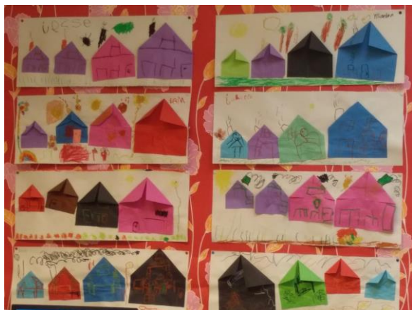
Huisjes in groep 1/2

Gaat woensdag 21 oktober naar het natuurpad in Bergen. Als start voor het project "natuur".